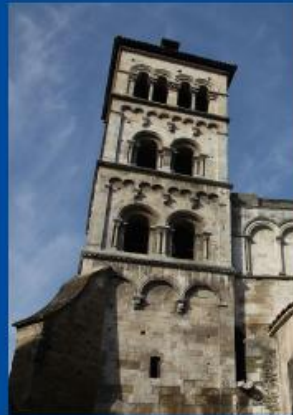
Bildangabe Titelseite: ...Saint-André-le-Bas in Vienne; Foto: Oksufy; CC-BY-SA-3.0.....